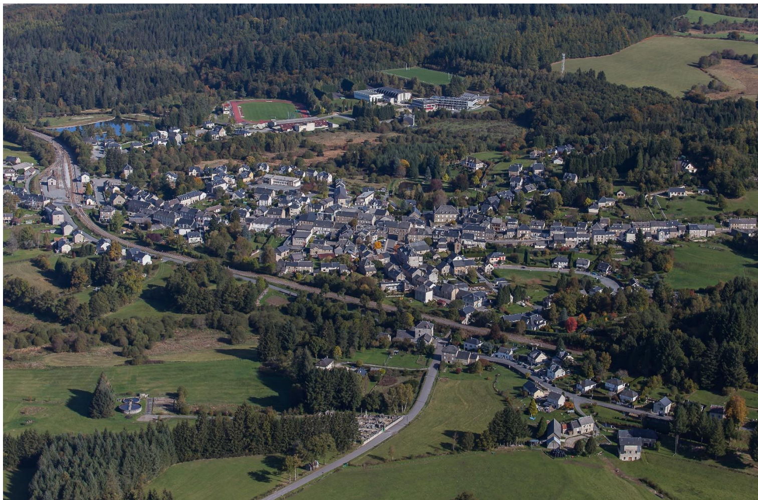
Photo aérienne, prise d'un drone en 2015